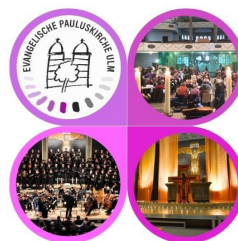
... damit weiter Gutes drin ist! Außensanierung der Pauluskirche